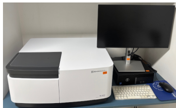
SHIMADZU – RF-6000 Espectrofluorímetro Spectrofluorometer