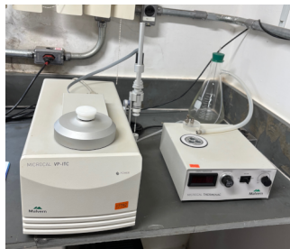
MALVERN – MicroCal VP-ITC Calorímetro de Titulação Isotérmica Isothermal Titration Calorimeter (ITC)