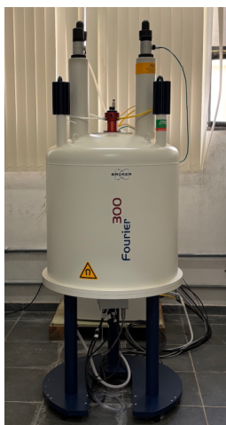
BRUKER – Fourier 300 MHz Espectrômetro de Ressonância Magnética Nuclear Nuclear Magnetic Resonance Spectrometer (NMR)