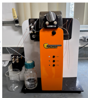
BIONAVIS – Navi-200 Sistema de Ressonância Plasmônica de Superfície Surface Plasmon Resonance (SPR) Instrument