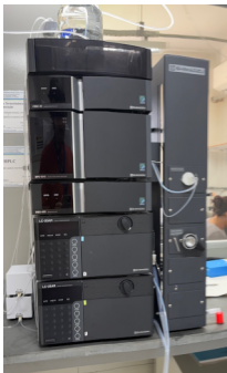
SHIMADZU – LC-20AR Cromatógrafo Líquido de Alta Eficiência (CLAE) High-Performance Liquid Chromatograph (HPLC)