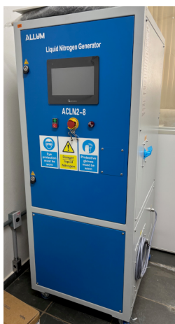
ALLUM – ACLN2-08S Liquefator de Nitrogênio Nitrogen Liquefier