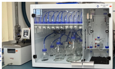
CSBio – CS136X Sintetizador Automático de Peptídeos Automated Peptide Synthesizer